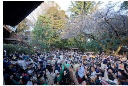
節分会に参集した人々