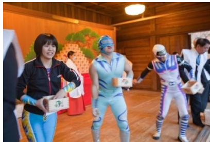
板橋プロレスも豆まき