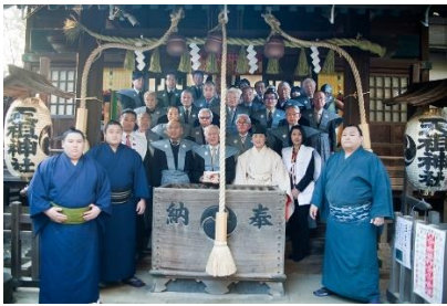
節分会に常盤山部屋の力士