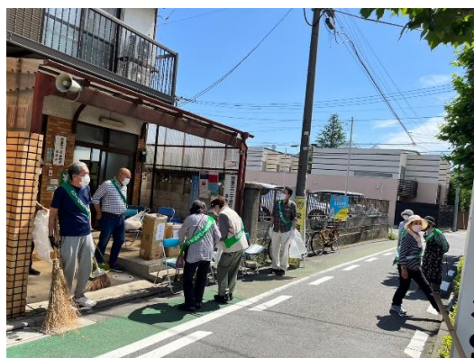
9:00 に町会事務所前に集合